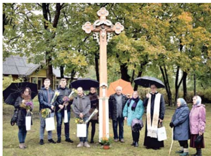
Kryžiaus Niūronyse šventinimo iškilmė.