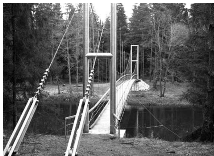
Akcija vyks prie ir ant Mikierių - Inkūnų kabančiojo tilto per Šventąją.