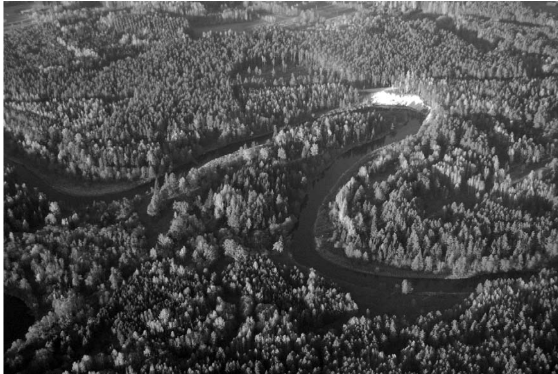
Akcijos rengėjai siekia išsaugoti Šimonių girią.

Spalio 6 dieną, sekmadienį, 15 val. Šimonių girioje gyvenantys menininkai, gydytojai, verslininkai kviečia visus, neabejingus gamtos situacijai, susikibti į gyvąją grandinę girioje, ties Inkūnų-Mikierių kabančiuoju tiltu per Šventąją. Pasak akcijos rengėjų, taip simboliškai bus sujungti girios krantai ir parodyta, kad žmonėms rūpi girios ir Lietuvos likimas.