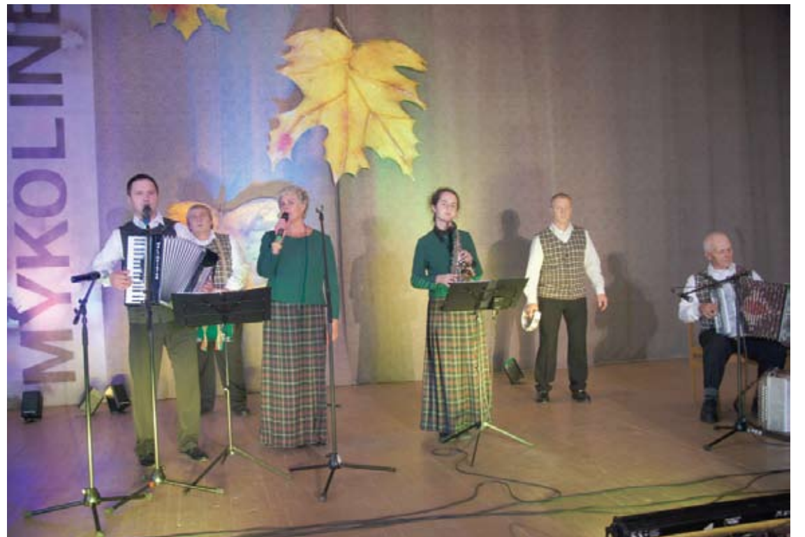
Vienas iš šventėje koncertavusių kolektyvų - kapela „Vingerinė“.