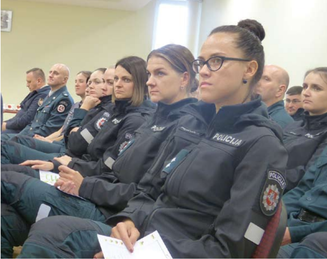
Gera turėti savo Angelą sargą. Dar smagiau, kai jis (t.y. ji) yra ir gražus...