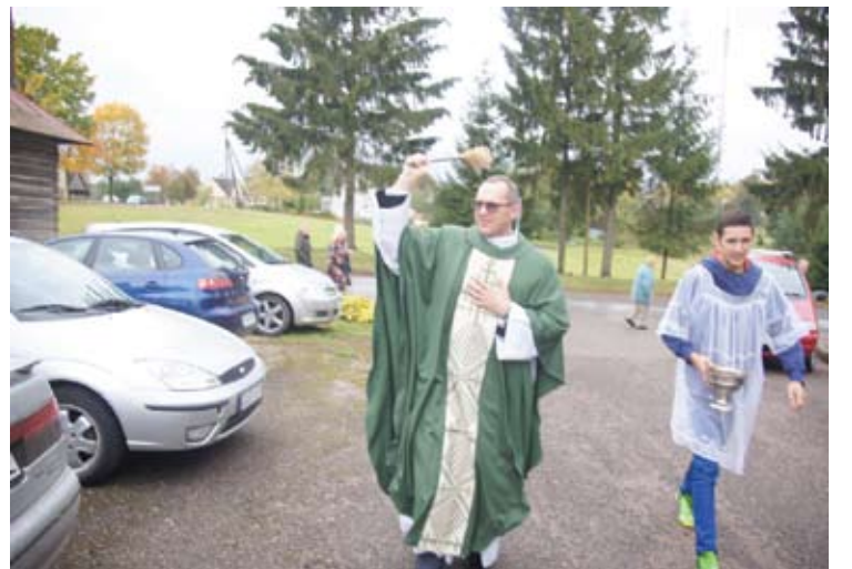
Po šv. Mišių buvo šventinami tikinčiųjų automobiliai, kad būtų apsaugoti nuo avarijų ir kitų nelaimių.