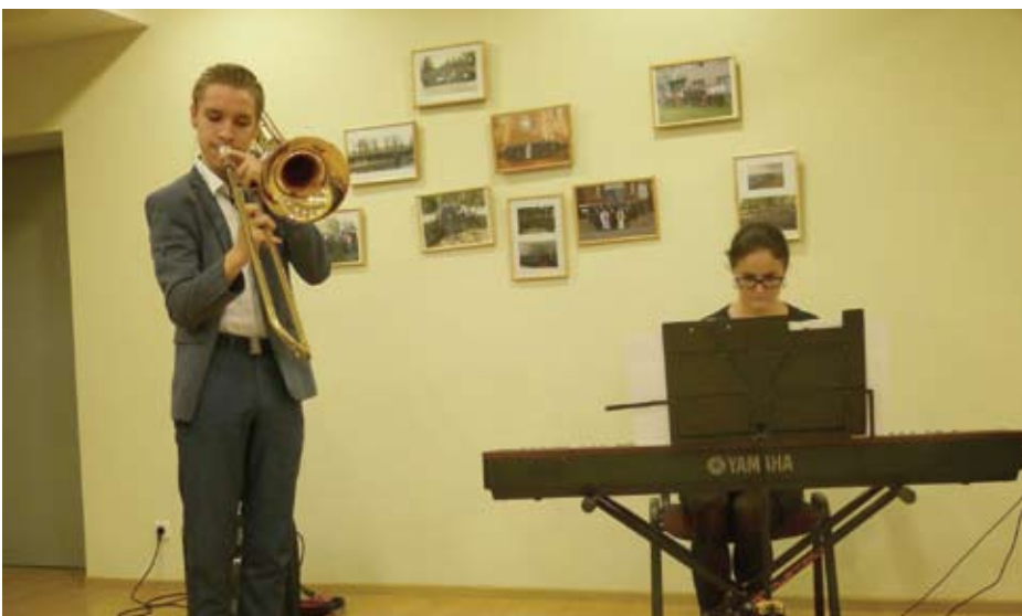
Policijos pareigūnus profesinės šventės dieną sveikino ir jaunieji muzikantai.