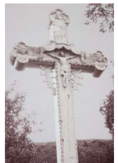
Štai taip atrodė originalusis 1921 m. Kuniškių kaime, prie Anykščių, pastatytas kryžius.